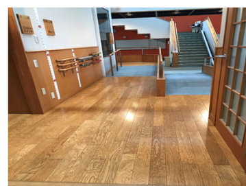
【手すり】手すり選定