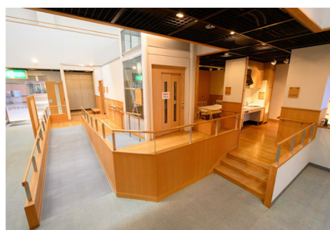
【スロープやレール架台】